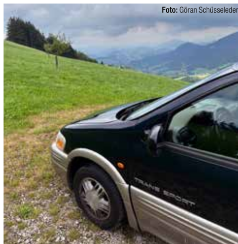
Blivande klassiker i Österrike.

I de flesta EU-länderna gäller att föraren har en varselväst lätt åtkomlig. Utöver en varnings-