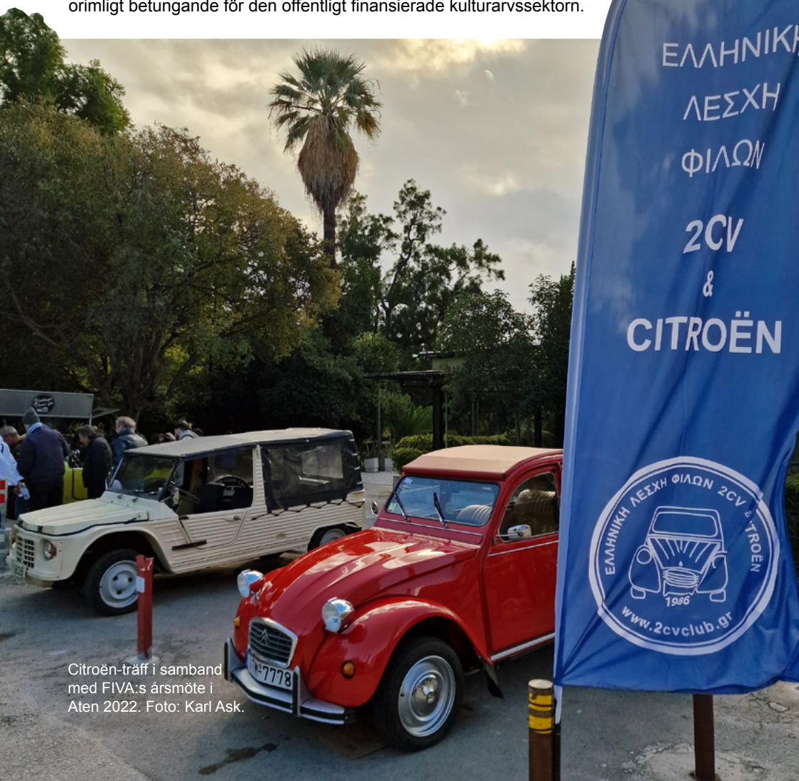
Citroën-träff i samband med FIVA:s årsmöte i Aten 2022.

Samverkan mellan civilsamhällets organisationer och kulturarvsexperter, nationellt och internationellt, bör utformas som ett partnerskap. Endast på det sättet kan motorismens omfattande kulturarv fortlöpande värderas och bevaras, dessutom på ett sätt som inte blir orimligt betungande för den offentligt finansierade kulturarvssektorn.