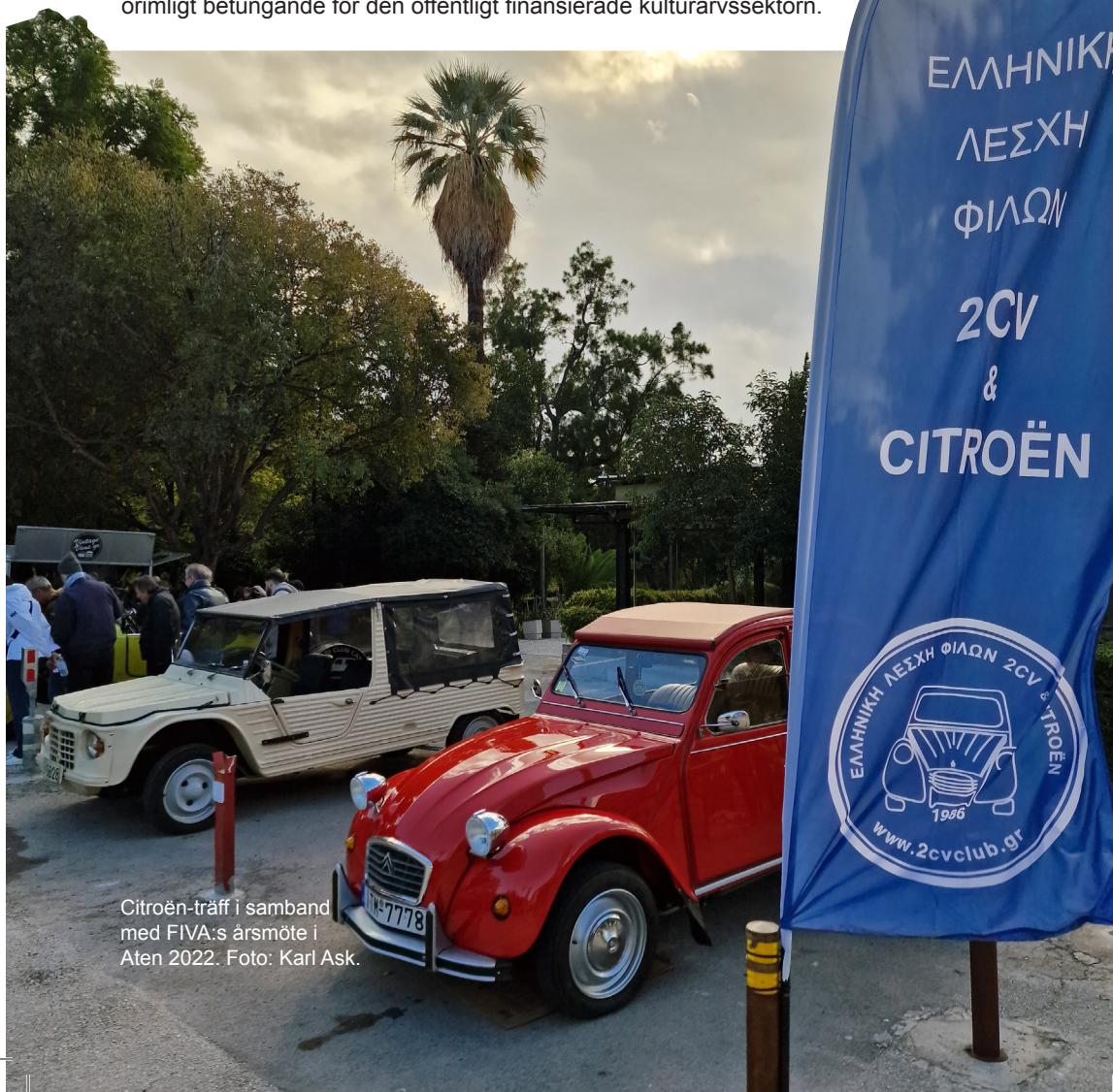
Citroën-träff i samband med FIVA:s årsmöte i Aten 2022.

Samverkan mellan civilsamhällets organisationer och kulturarvsexperter, nationellt och internationellt, bör utformas som ett partnerskap. Endast på det sättet kan motorismens omfattande kulturarv fortlöpande värderas och bevaras, dessutom på ett sätt som inte blir orimligt betungande för den offentligt finansierade kulturarvssektorn.